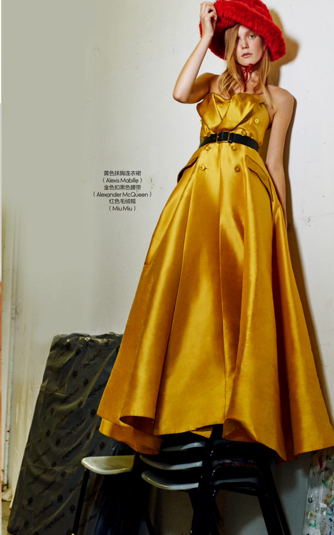
黄色抹胸连衣裙 (Alexis Mabille) 金色扣黑色腰带 (Alexander McQueen) 红色毛绒帽 (Miu Miu)